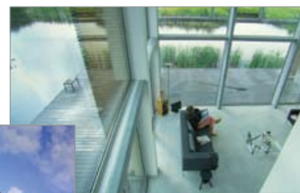
Wonen in Het Riet