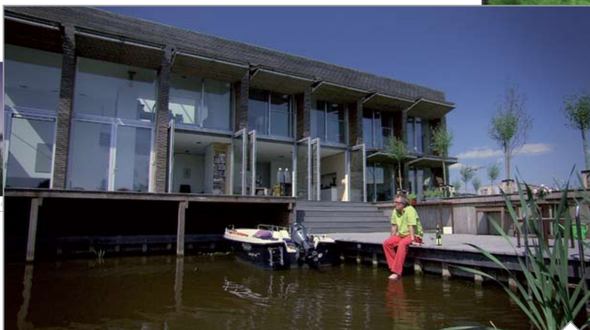
Thuis komen in Het Riet