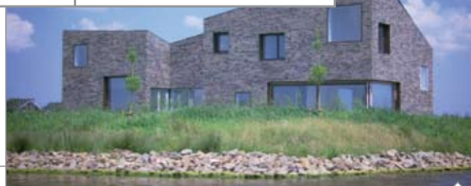
Varen Rondom De Wei