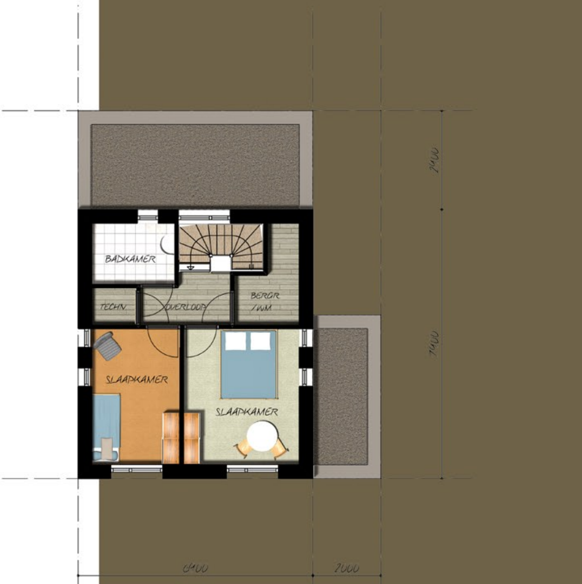
EERSTE VERDIEPING indeling optioneel