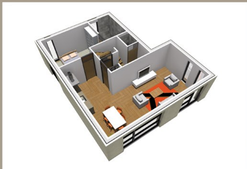
IMPRESSIE BEGANE GROND

Extenzo BV Gotenburgweg 34 9723 TM Groningen info@extenzogroningen.nl 050 5492750