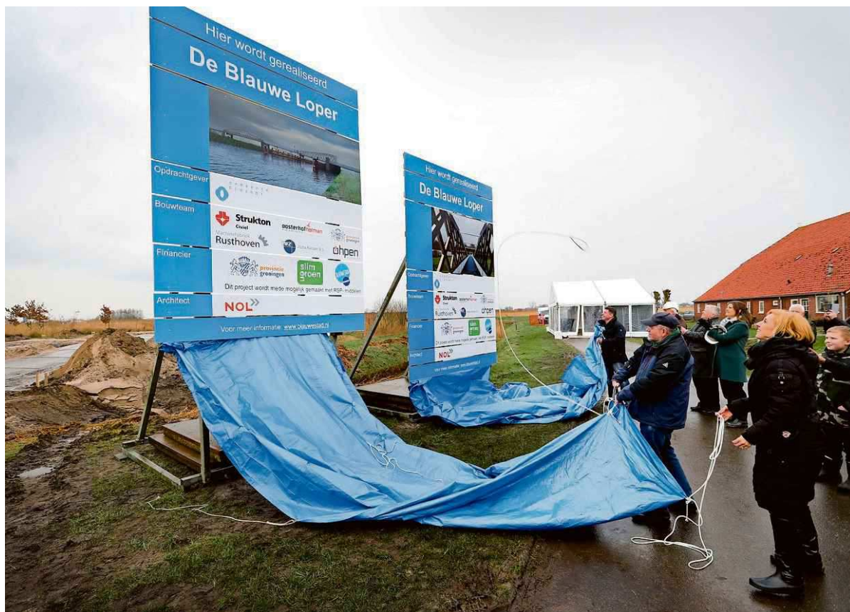
De onthulling van de bouwboarden van De Blauwe Loper.

Spannend wordt het ergens in oktober als de houten brug per ponton wordt aangevoerd vanuit Kampen, om daarna over het Winschoterdiep en de A7 getakeld te worden. Met Rijkswaterstaat wordt nagedacht over een geschikt moment voor de takelwerkzaamheden, waarvoor zeker drie kranen nodig zijn. De A7 moet daarvoor worden gestremd. De takelwerkzaamheden worden vrijwel zeker in een weekend uitgevoerd, als de verkeersdruk wat minder is dan door de week. De bouwers