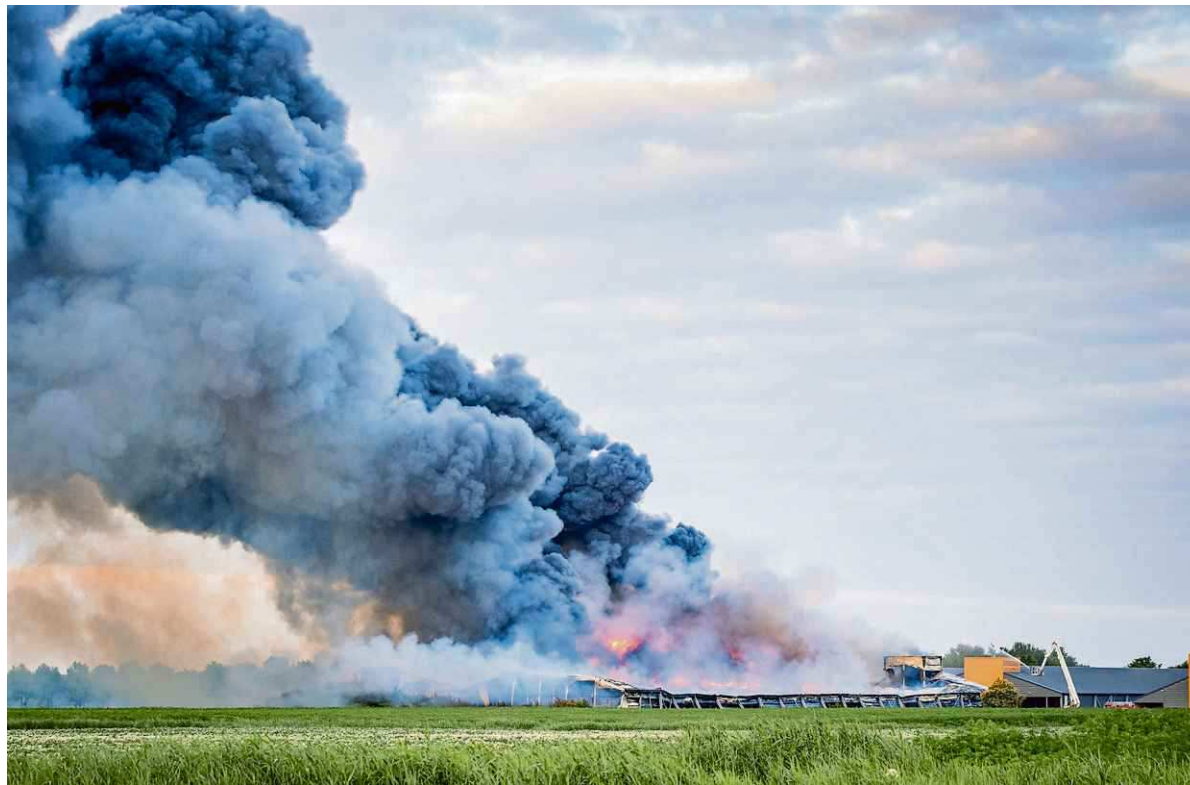
De brand in de twee kippenschuren ging met veel rook gepaard.

Al snel na de brand circuleerde op sociale media een filmopname, gemaakt door camera's op het bedrijf. Een man lijkt doelbewust brand te