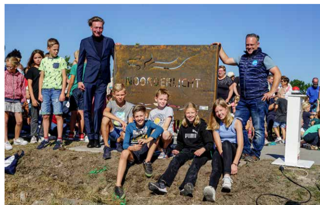
Feestelijke opening aanlegsteiger Noorderlicht