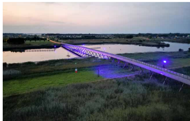
Verlichte Pieter Smitbrug in aanloop naar Waterbei