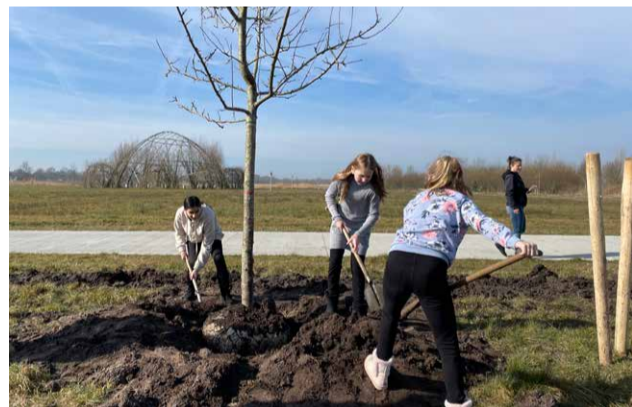
Basisschoolleerlingen planten nieuwe fruitbomen

In 2021 werd een record aantal kavels verkocht in Blauwestad. Het gevolg laat zich raden: 2022 stond bol van de bouwactiviteiten. Aannemers, klusbedrijven en projectontwikkelaars reden af en aan. En ook al zijn kopers ook hier wat voorzichtiger geworden, met ruim 100 gepasseerde aktes, sluit het Projectbureau Blauwestad dit jaar opnieuw af met mooie cijfers. Deze zomer werd zelfs de 1.000 e bewoner verwelkomd. Een mooi moment om terug te blikken én vooruit te kijken.